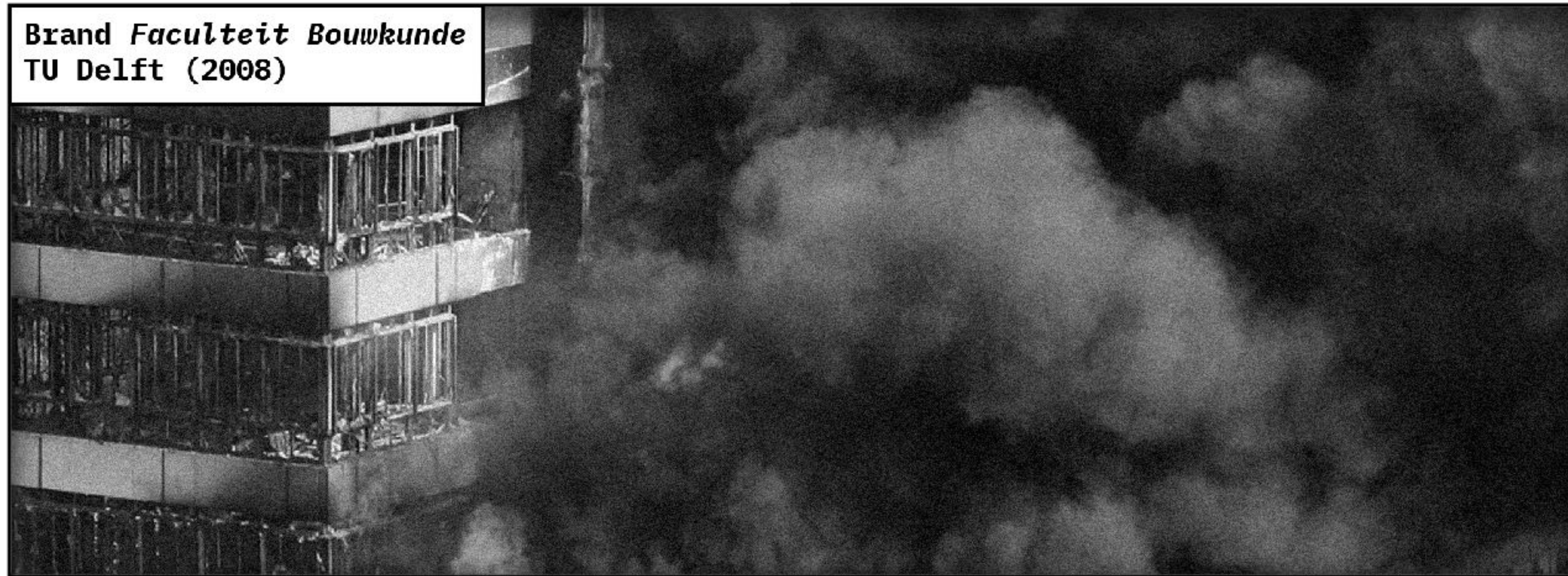
Brand Faculteit Bouwkunde TU Delft (2008)