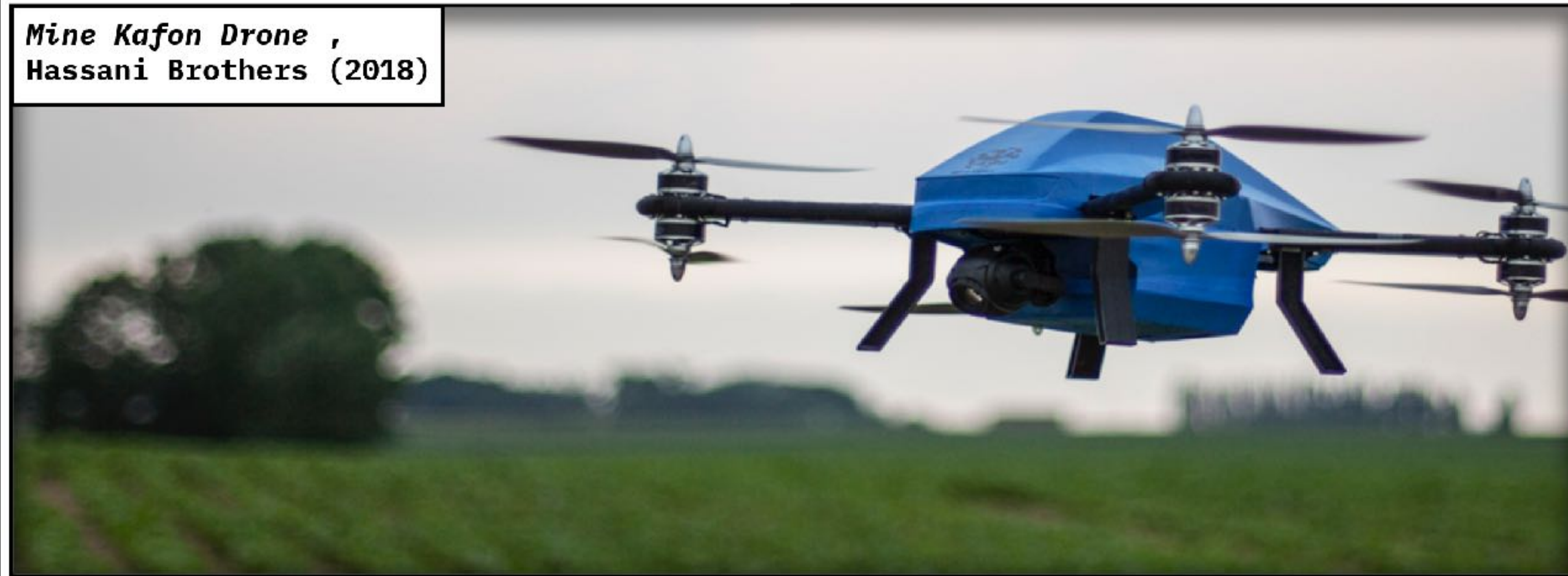
Mine Kafon Drone , Hassani Brothers (2018)