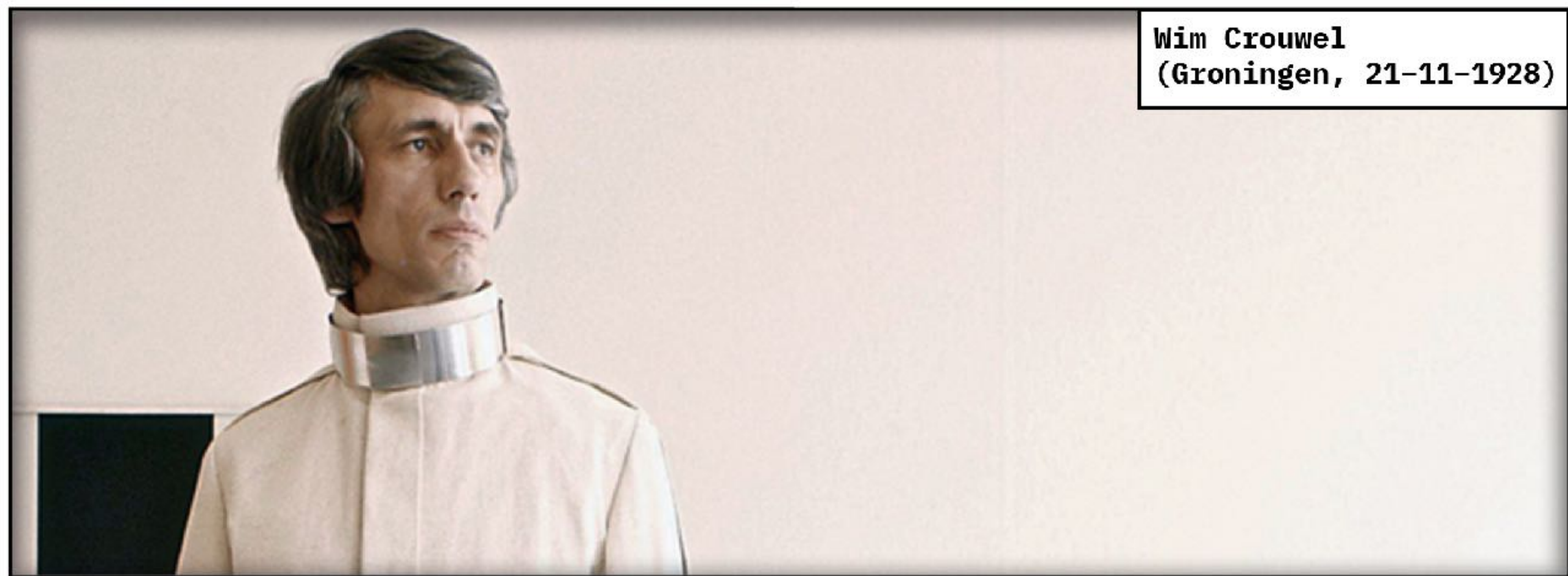
Wim Crouwel (Groningen, 21-11-1928)