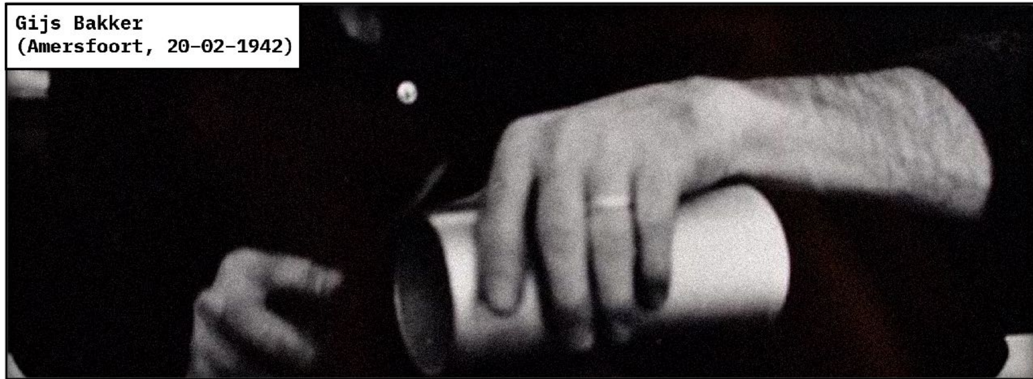
Gijs Bakker (Amersfoort, 20-02-1942)